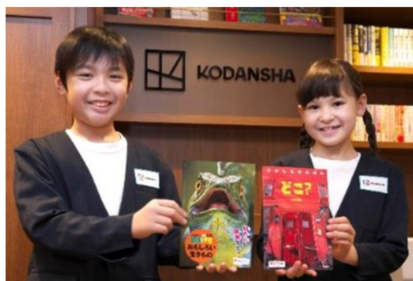
オリジナルの絵本や図鑑を作成