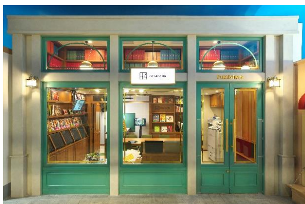
「出版社」パビリオン外観

このたび、キッザニア東京の完全ガイドブックの発売とパビリオンリニューアルの2点をお知らせいたします。